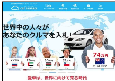
〈カー・コネクトサイト〉