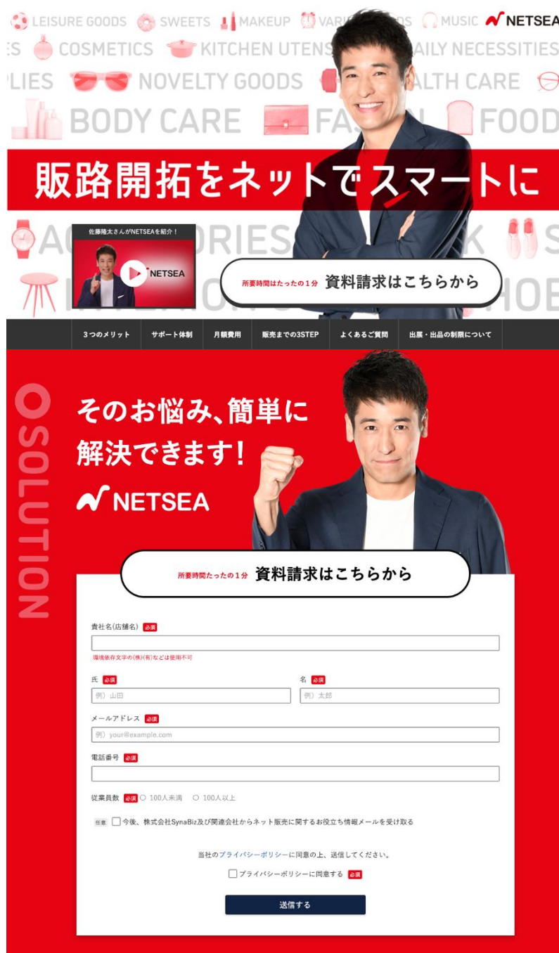
今回リニューアルされたご案内ページの冒頭部分

また、今回の説明動画にあわせ、イメージキャラクターとして就任した佐藤隆太さんを前面に押し出した、出展企業様向けのご案内ページの全面リニューアルをいたしました。こちらのご案内ページは、出展企業様（サプライヤー様）を募集するページとなります。