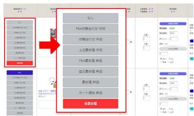
出品後もカテゴリを選択すると自動価格改定が可能