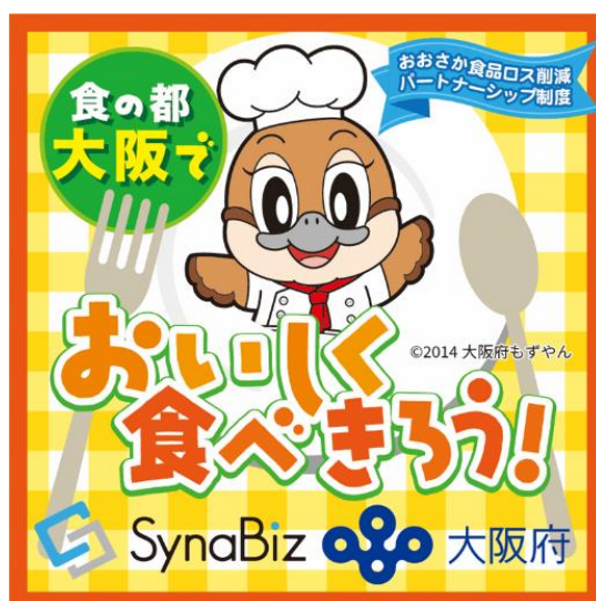
SynaBiz×大阪府 おいしく食べきろう！公式ロゴマーク

SynaBiz はこれまで寄付型ショッピングサイト Otameshi（読み方：「オタメシ」）の運営を通じて様々な廃棄ロス問題に取り組んでまいりましたが、今後は自治体との連携も深めながら更に活動の幅を広げ、SDGs 貢献活動を推進してまいります。